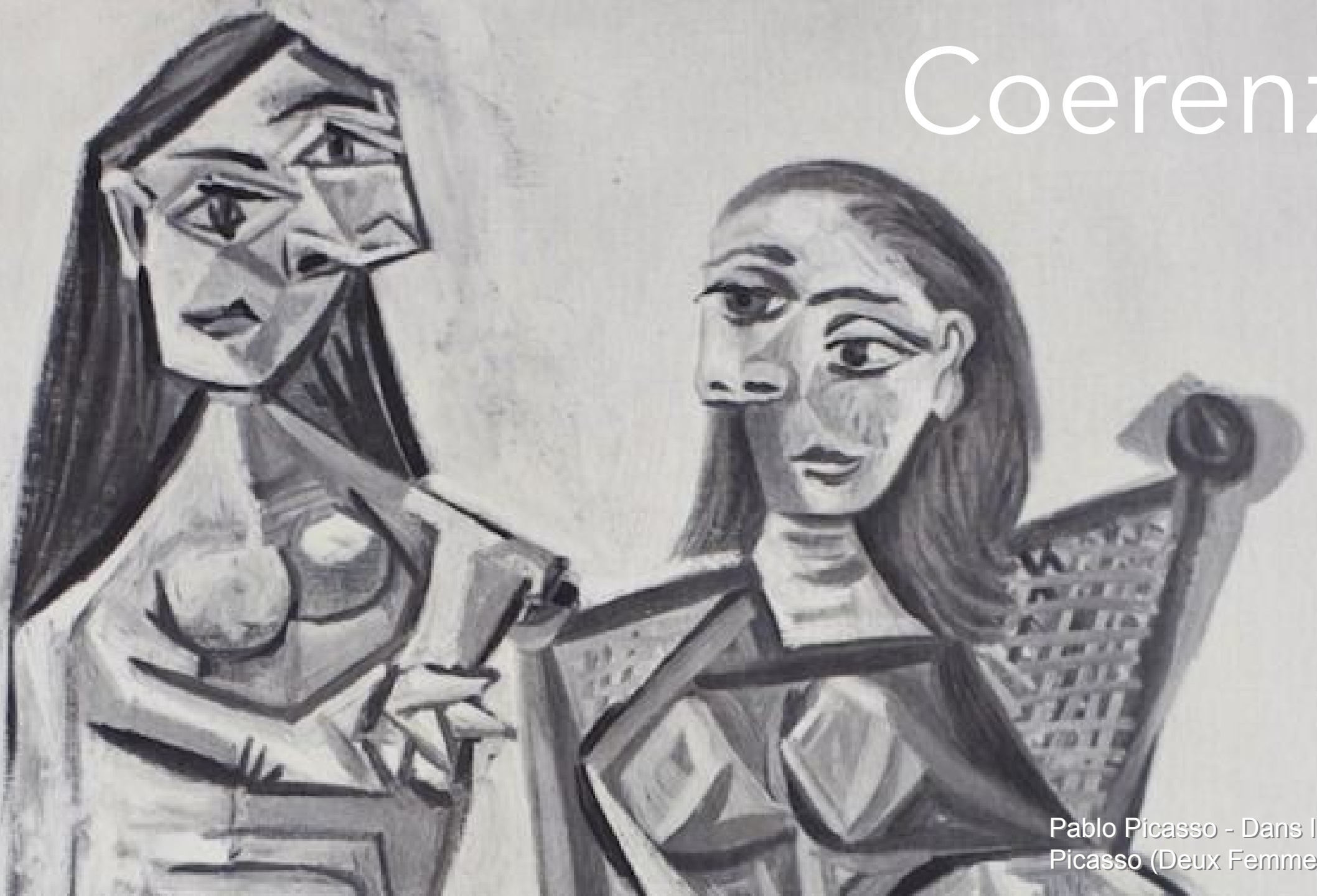
Pablo Picasso - Dans l'Atelier de Picasso (Deux Femmes), 1939